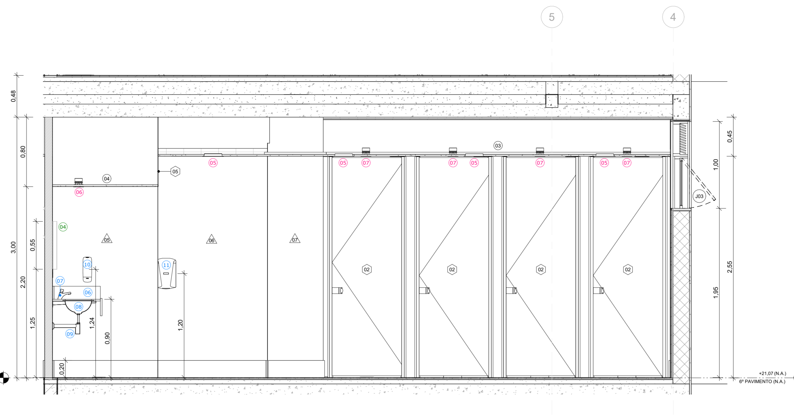
3 SANITÁRIOS ALA ESQUERDA - CORTE F ESCALA 1:25